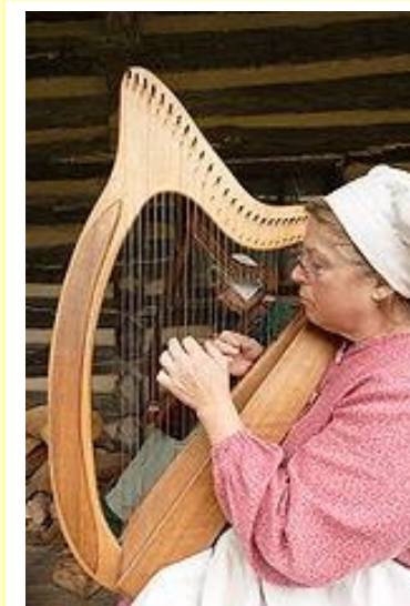
ケルティック(アイリッシュ)ハープ