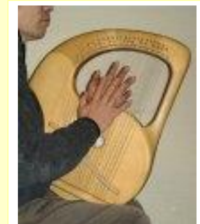
ゲルトナーライアー