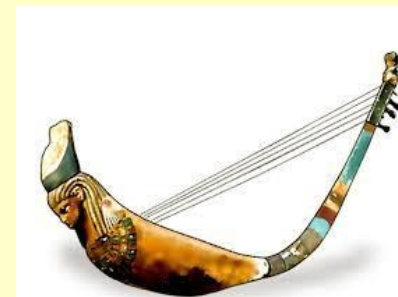
古代エジプトのハープ